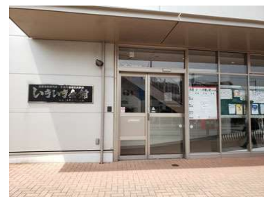
会場の「いきいき会館」