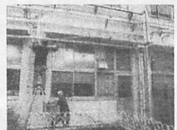
▲ミストシャワーの設置 (技術員)

例年より短い夏休みを終え、元気な子どもたちが学校に戻ってきました。暑い日々が続く中、学校では引き続き、熱中症予防、感染症拡大防止に配慮しながら教育活動を行っています。現在、体育や外遊びなどの運動の可否は、市より配付された熱中症指数計(WBGT)によって判断しています。また、西昇降口に続き、東昇降口付近にもミストシャワーを新たに設置しました。少しでも涼