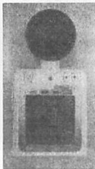
▲熱中症指数計 を味わえればよいのですが…。

例年より短い夏休みを終え、元気な子どもたちが学校に戻ってきました。暑い日々が続く中、学校では引き続き、熱中症予防、感染症拡大防止に配慮しながら教育活動を行っています。現在、体育や外遊びなどの運動の可否は、市より配付された熱中症指数計(WBGT)によって判断しています。また、西昇降口に続き、東昇降口付近にもミストシャワーを新たに設置しました。少しでも涼