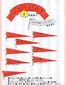
スタンプラリーのMAPIはママたちの手作り