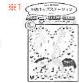
※1 日吉キッズステーションに特集されました