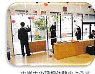
中学生の職場体験のようす