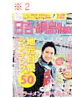
※2 こんぺいとうがのったよ!