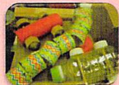
おもちゃを作って遊んだよ!