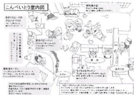
開設当初の手書きリーフレットイラスト 現在は第4版

10周年にむけてアンケートをお願いしました。利用者さんからたくさんの心暖まるメッセージを頂きました。ご協力とともにお礼を申し上げます。