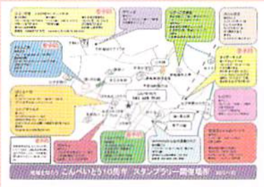
地域を知ろうスタンプラリー