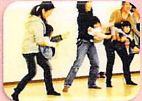
ベビーヨガ 楽しそう~♪