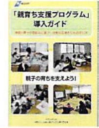
「親育ち支援プログラム」導入ガイド 親子の育ちを支えよう!