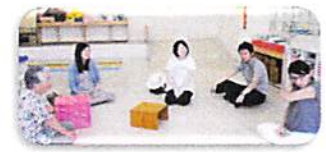
プレママから広場デビュー(マタニティ広場)