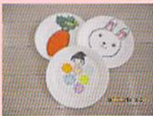
常連ママによる手作りオモチャ