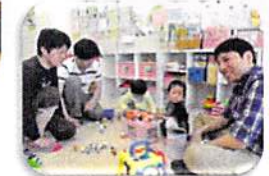
パパと一緒にのこんぺいとうさん!