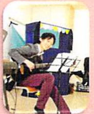
パパのギター演奏会 カッコいい!