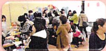
もったいない市、大盛況!