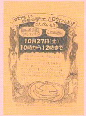
ハロウィンで仮装して 地元商店街へ