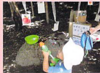
“チームおめで鯛”による「外でダイナミックに遊ぼう」