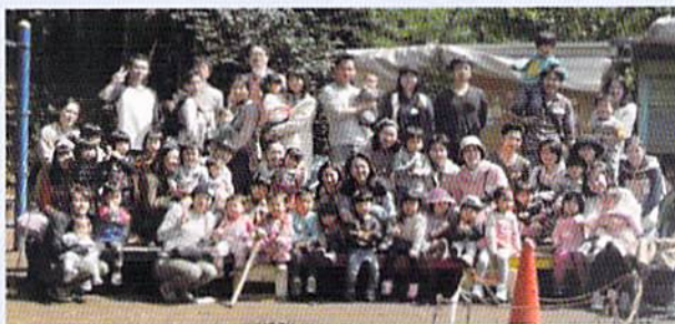
同窓会 ファミリーで集合!

「ノーバディズ パーフェクト」プログラムを活用した連続講座。 近年は2,3歳児イヤイヤ期を中心に開催。 2010年11月を皮切りにすでに16期生になっています。