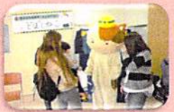
土木ネコがやって来た!

3月4日 ヨガ体操・リズム体操・ギター演奏会・公園で外遊び・もったいない市・手作りおもちゃコーナー・スタンプラリー・我が子自慢写真展など行いました。