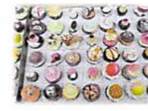
夜店で大人気だったスイーツマグネット