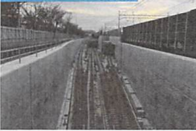
④JR貨物横浜羽沢駅付近

地下の羽沢横浜国大駅※からJR線につながる区間でも、軌道工事が完了。現在、電車線などの電気工事を行っています。