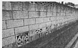
コンクリートブロック塀

(※1) ①通学路上の既存ブロック塀等の調査で、横浜市の技術職員が現地をチェックし改善の必要があると判断されたもの。 ②市職員や市が委託した専門家が現地を確認し、改善の必要があると判断されたもの。